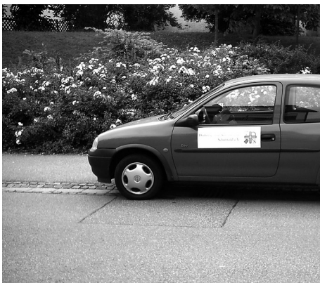
Aktion 99 „Meine Hilfe - Deine Hilfe“ Autohaus Knapp.