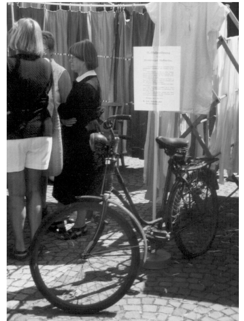
Der „Historische Markt“ in Baltmannsweiler 1999

Flensburg, den 3. Mai 1913 Ev.Luth.Diakonissenanstalt Der Hausvorstand