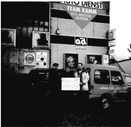
Aktion 96 „Meine Hilfe - Deine Hilfe“ Autohaus Team Kamm.