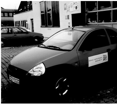
Aktion 97 „Meine Hilfe - Deine Hilfe“ Autohaus Eber.