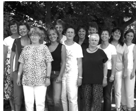
Das Team der organisierte Nachbarschaftshilfe in Baltmannsweiler