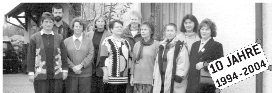
Vor 10 Jahren in Baltmannsweiler...

Die Diakonie- und Sozialstation Schurwald e.V. hat sich zum Ziel gesetzt, für die Patienten das Gerüst der ambulanten Versorgung zu sein und durch ihren „Dienst am Menschen“ ein Leben in der gewohnten Umgebung, trotz eines Hilfebedarfes, zu ermöglichen.